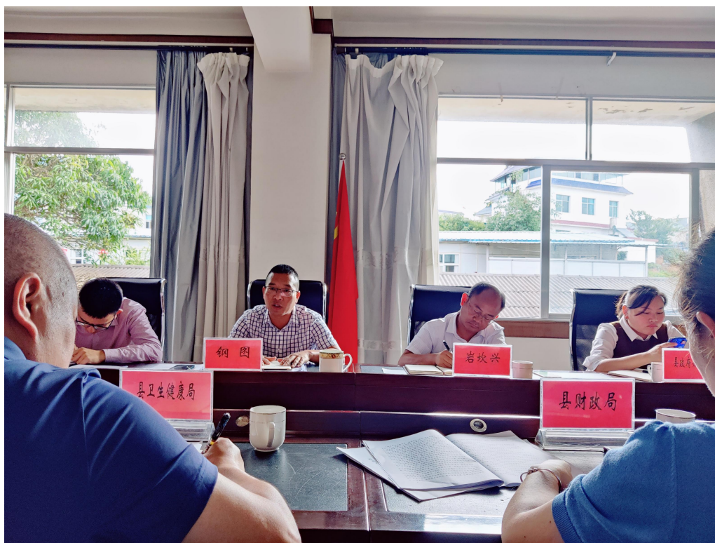
图二：各部门发言研究工作举措

会议指出，医疗共同体建设是解决“看病难、看病贵”，进一步合理分配“卫生资源”的重要工作，是事关人民群众幸福的大事，体现了我党一切为了人民、紧紧依靠人民、不断造福人民的初心和使命。必须坚持以人民群众需求为导向，全力推动包括医共体建设在内的各项医疗改革工作落地生效。