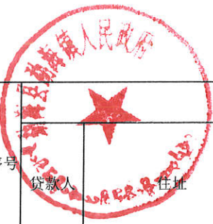
勐海镇农转城居民贷款政府贴息统计表