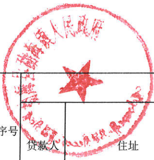
勐海镇农转城居民贷款政府贴息统计表