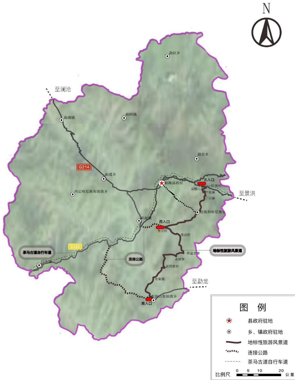
图 3：勐海户外游憩圈旅游交通网络图