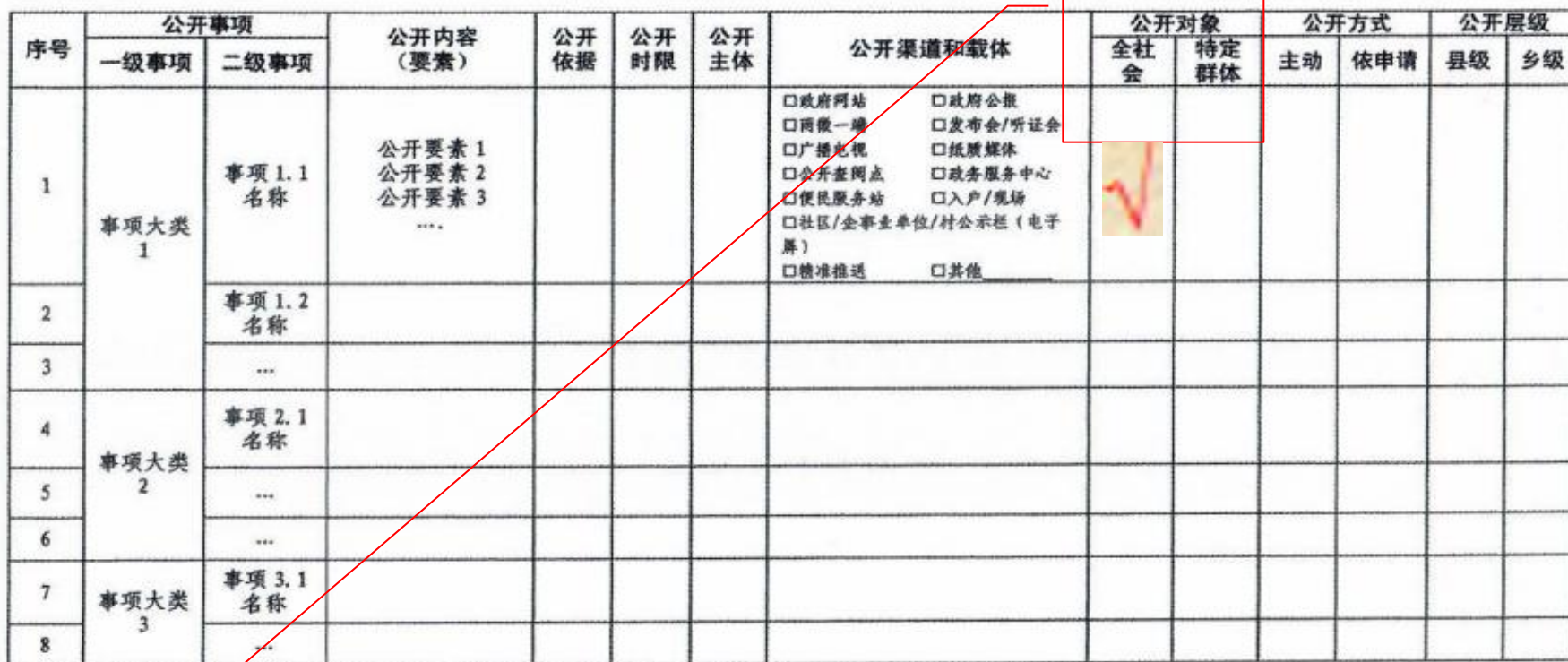
XX 领域基层政务公开标准目录模板